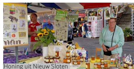
Honing uit Nieuw Sloten

Het is de bedoeling dat de winkeliers meeprofiteren als het winkelcentrum door de markt aantrekkelijker is.◀